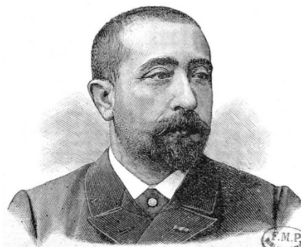
M. le Dr. GILLES DE LA TOURETTE. Médecin des Hôpitaux de Paris, directeur en chef du service médical de l'Exposition de 1900.

1857-1904, Georges Albert Édouard Brutus Gilles de la Tourette (1885 kuvattu TGS) Neuropsykologian prof.